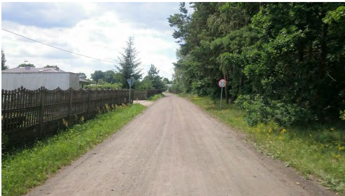
Zdjęcie 3 Końcowy odcinek przebudowywanej drogi ok. km 1+500,00- widok od strony drogi krajowej nr 91