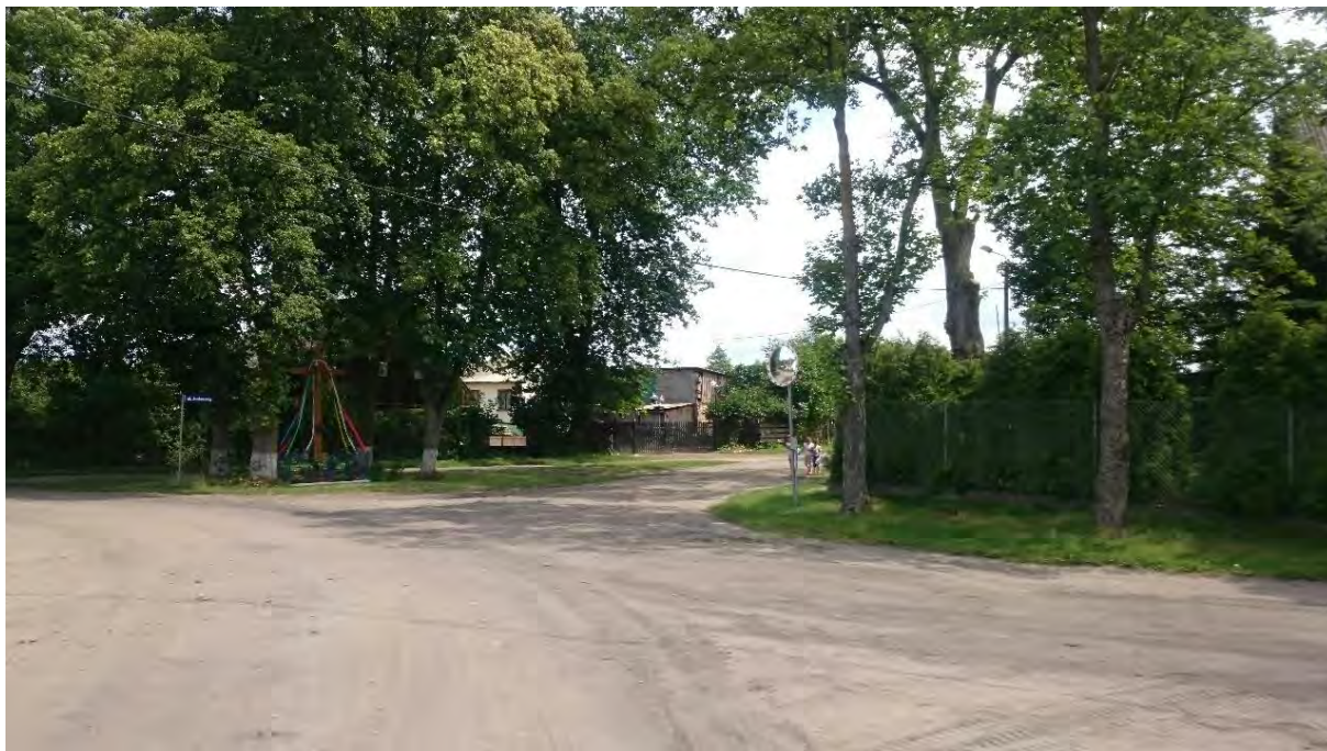
Zdjęcie 2 Środkowy fragment projektowanej drogi gminnej ok. km. 1+200,00