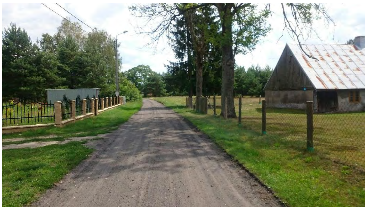
Zdjęcie 1 Początkowy fragment opracowania